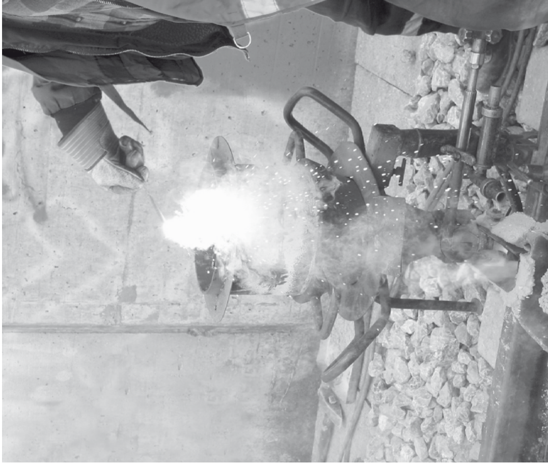
Der Oberbau muss ständig unterhalten und erneuert werden. Zwischen Mäischer und Neue Forch war ein Gleisstück zu ersetzen. Nach Heraustrennen des schadhaften Teils wird das neue, vorbereitete Stück eingepasst. Danach werden die beiden Schienenstöße im aluminothermischen Schweißverfahren verschweisst.