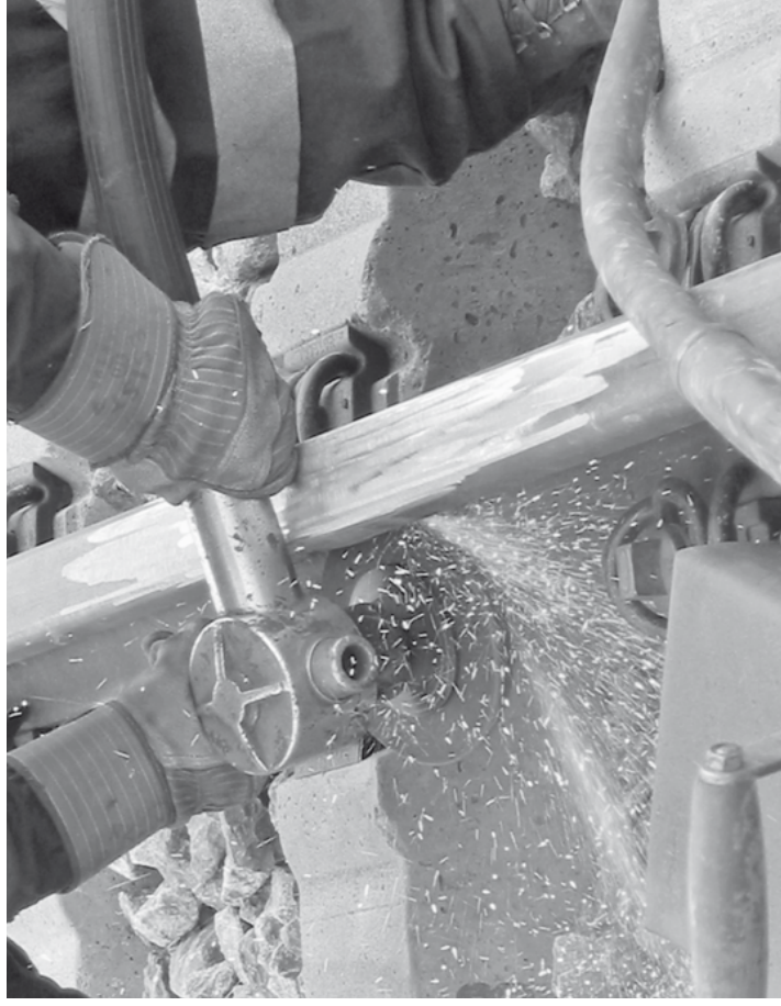
Anschließend werden die Schweißnähte geschliffen, um eine glatte Schienenoberfläche zu erhalten. Dadurch wird deren Verschleiss wie auch die Abnützung der Räder minimiert und eine optimale Laufruhe des Rollmaterials erreicht.